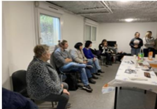
Labo d'usage Charlotte aux fraises